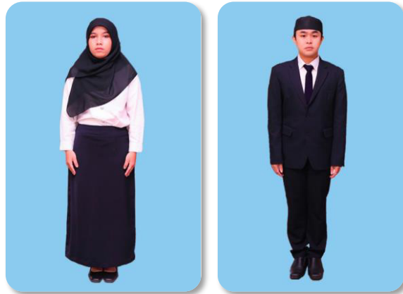
ภาพที่ ๓ การแต่งกาย สำหรับมุสลิม

๔. ในระหว่างพิธีพระราชทานปริญญาบัตร ให้ผู้เข้ารับพระราชทานปริญญาบัตรสวมครุยวิทยฐานะตามสีที่กำหนดตามประกาศสภาสถาบันบัณฑิตพัฒนบริหารศาสตร์ เรื่อง สีประจำคณะ/หน่วยงาน ที่จัดการเรียนการสอน ดังนี้